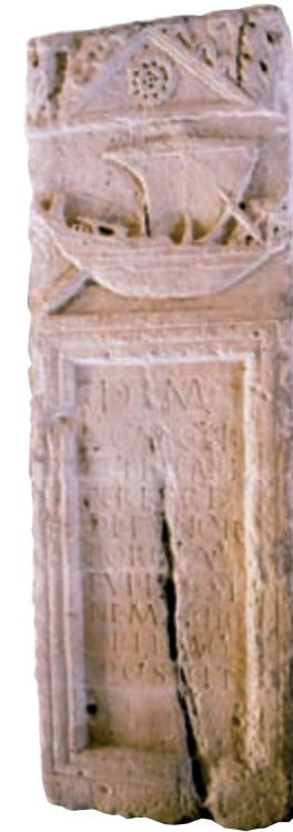
Estela funerària de la nau, segle II dC

La ciutat de Dertosa, citada a les fonts clàssiques i cap d'un extens municipium, s'amaga sota l'actual Tortosa, on s'han trobat restes que posen de manifest la importància adquirida per la seva situació estratègica en el punt de connexió entre la Mediterrània i l'Ebre.