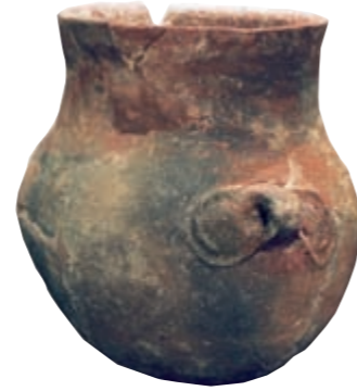
Vas amb decoració en relleu, neolític

La prehistòria al curs inferior de l'Ebre és una època de grans canvis mediambientals i culturals, en què trobem els primers instruments de pedra i d'os, ceràmiques, objectes d'ornament corporal i les primeres manifestacions artístiques.