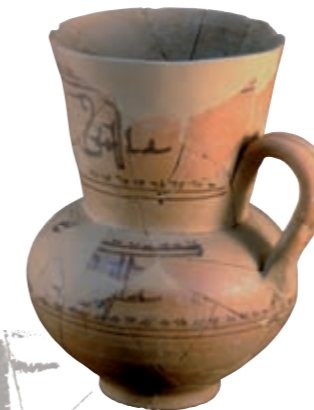
Gerra andalusina, segle XII

Turtuxa esdevingué una de les ciutats andalusines més importants del llevant peninsular enriquida per l'activitat comercial. D'ella han perdurat excel·lents mostres materials. La toponímia de bona part de poblacions ebrenques d'avui evidencia el seu origen andalusí