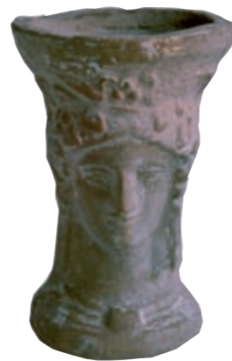
Bust femení, segle IV-III aC

Les Terres de l'Ebre van ser habitades pels ilercavons. Els seus vestigis a les nostres terres -poblats, objectes de metall, ceràmiques o la mateixa escriptura- ens parlen d'una societat desenvolupada, amb estrets lligams amb d'altres pobles mediterranis.