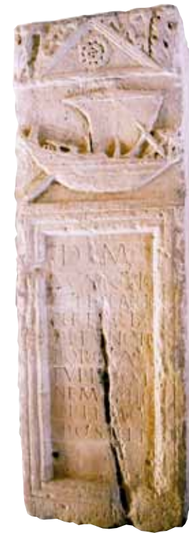
Estela funerària de la nau, segle II dC

La ciutat de Dertosa, citada a les fonts clàssiques i cap d'un extens municipium, s'amaga sota l'actual Tortosa, on s'han trobat restes que posen de manifest la importància adquirida per la seva situació estratègica en el punt de connexió entre la Mediterrània i l'Ebre.