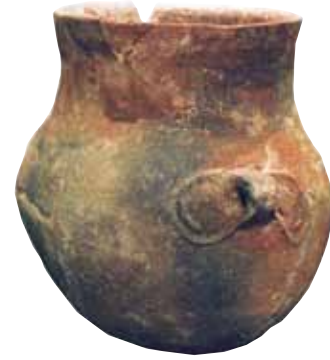
Vas amb decoració en relleu, neolític

La prehistòria al curs inferior de l'Ebre és una època de grans canvis mediambientals i culturals, en què trobem els primers instruments de pedra i d'os, ceràmiques, objectes d'ornament corporal i les primeres manifestacions artístiques.