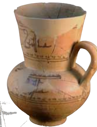
Gerra andalusina, segle XII

Turtuxa esdevingué una de les ciutats andalusines més importants del llevant peninsular enriquida per l'activitat comercial. D'ella han perdurat excel·lents mostres materials. La toponímia de bona part de poblacions ebrenques d'avui evidencia el seu origen andalusí