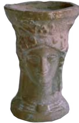
Bust femení, segle IV-III aC

Les Terres de l'Ebre van ser habitades pels iler-cavons. Els seus vestigis a les nostres terres -poblats, objectes de metall, ceràmiques o la mateixa escriptura- ens parlen d'una societat desenvolupada, amb estrets lligams amb d'altres pobles mediterranis.