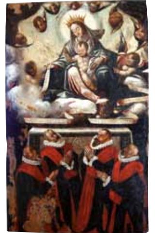
Taula de la Verge dels Procuradors, segle XVI

Amb la conquesta cristiana del segle XII, la Turtuxa islàmica esdevé Tortosa. Durant els segles següents la ciutat va adquirir un destacat paper polític, econòmic i religiós com a capital de Vegueria i Diòcesi.