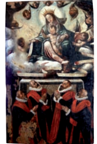
La Virgen de los Procuradores, tabla del siglo XVI

Después de la conquista cristiana del siglo XII, la Turtuxa islámica se convierte en Tortosa. Durante los siglos siguientes la ciudad desempeñó un destacado papel político, económico y religioso como capital de la Veguería y por su extensa e importante Diócesis.