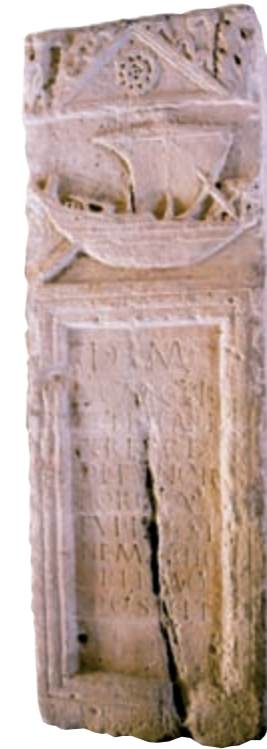
Estela funerària de la nau, segle II dC

La ciutat de Dertosa, citada a les fonts clàssiques i cap d'un extens municipium, s'amaga sota l'actual Tortosa, on s'han trobat restes que posen de manifest la importància adquirida per la seva situació estratègica en el punt de connexió entre la Mediterrània i l'Ebre.