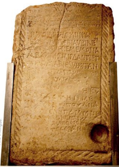
Pierre tombale trilingue

Tortosa, ville bimillénaire, possède un riche patrimoine permettant aux visiteurs de suivre les traces des peuples qui y ont vécu tout au long de son histoire. Juifs, Chrétiens et Sarrasins y cohabitèrent au Moyen Âge, dans une ville ouverte sur la Méditerranée grâce à un de ses biens les plus précieux : le fleuve Èbre.