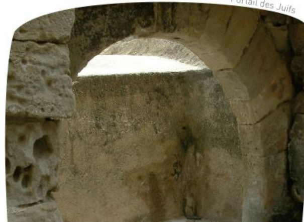
Portail des Juifs

Lorsque Turtuxa est conquise en 1148, Ramon Berenguer IV octroie l'ancien chantier naval arabe à la communauté juive. C'est ainsi que naît l'ancienne juiverie, le premier quartier habité exclusivement par des Juifs. D'après des sources documentaires, ce quartier contenait une synagogue, une boulangerie et une boucherie, aujourd'hui disparues. La nouvelle juiverie fut fondée au XIIIe siècle, dont il reste des vestiges au sein d'une partie de la muraille datant du XIVe siècle, avec la Tour de Célio et le Portail des Juifs, qui menait au cimetière juif.