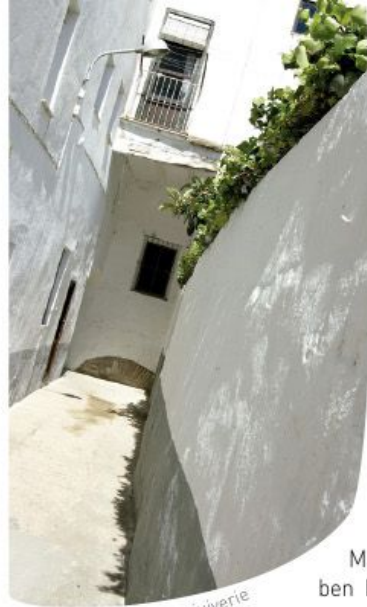
Rue de l'ancienne juiverie

Ce fut probablement la Dertosa romaine qui accueillit les premiers Juifs, bien que leur présence ne soit documentée qu'au VIe siècle, grâce à la datation de la célèbre pierre tombale trilingue, stèle funéraire dont l'inscription apparaît en hébreu, en grec et en latin, et qui peut être admirée actuellement dans l'exposition permanente de la cathédrale de Santa Maria.