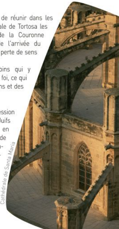
Cathédrale de Santa Maria

Les mesures de répression aboutirent à l'expulsion des Juifs de la Péninsule ibérique en 1492. En suivant le cours de l'Èbre, trois mille Juifs catalans et aragonais naviguèrent vers l'Italie.