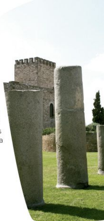
Château de la Suda

Le XIVe siècle voit s'ouvrir une période de forte pression sociale. Lors des émeutes de 1391, la plupart des juiveries de la Péninsule ibérique sont saccagées. À Tortosa, la révolte ne fut pas aussi sanglante car une ordonnance royale exigeait aux autorités locales de protéger les membres de l'aljama en les hébergeant au Château de la Suda.